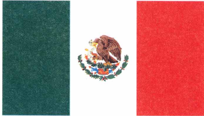
Emblema nacional de México